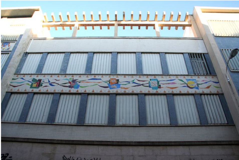
Fachada del IES San Isidoro.

El edificio actual fue construido en los años sesenta del pasado siglo en estilo racionalista sobre el solar del Palacio de los Zúñiga, edificado en los siglos XVI y XVII.