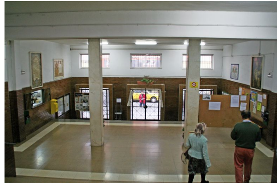
Dos vistas del vestíbulo del Instituto.