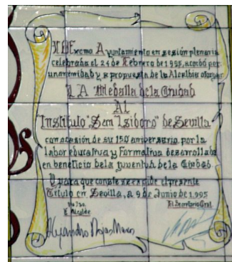
Azulejo conmemorativo de la concesión de la medalla de oro de la ciudad.