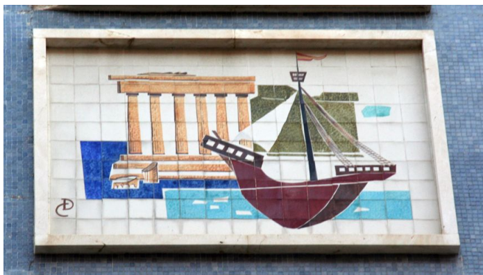
Decoración de la fachada.

La fachada posee tres cuerpos verticales que sirven de nexo de unión a los dos cuerpos horizontales de menor altura que acogen las aulas. Para igualar altura se utilizan unas pérgolas que acentúan la horizontalidad del edificio, marcada por las ventanas corridas apaisadas que tamizan la luz mediante lamas verticales. La única decoración la aporta el ancho friso cerámico que separa las plantas superiores. La falta de movimiento y linealidad de la fachada la rompe el cuerpo central que posee un balcón corrido con banderas y el escudo franquista.