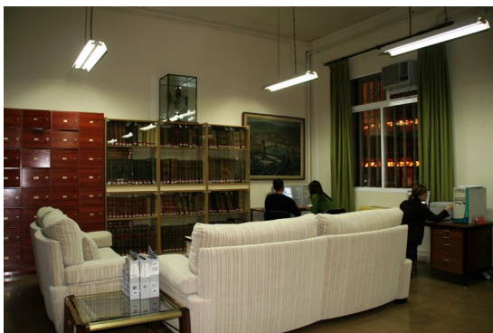
Sala de Profesores.