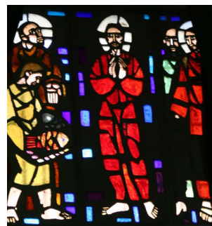
Vidrieras de la capilla.