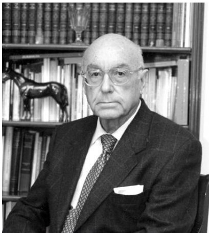
Manuel Clavero Arévalo, catedrático de Derecho Administrativo y político.