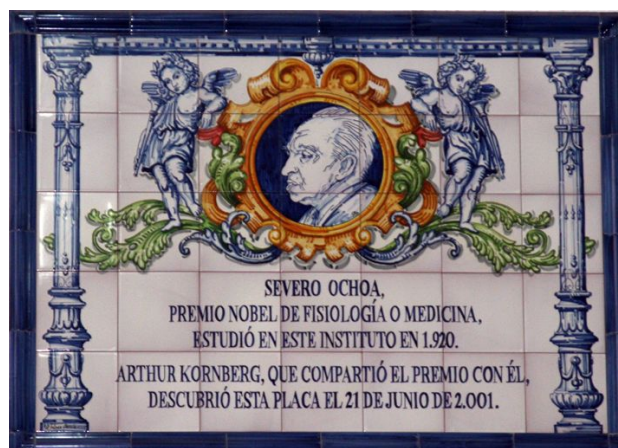
Severo Ochoa de Albornoz, científico. Premio Nobel de Fisiología y Medicina.