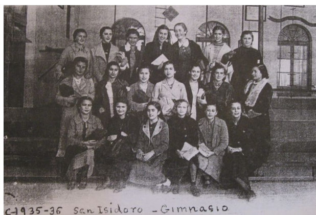
Alumnas del curso 1935-36.