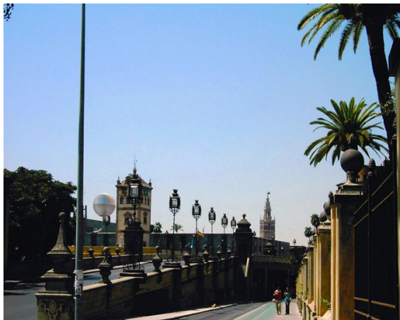
Diseño de Juan Talavera Heredia, arquitecto regionalista.