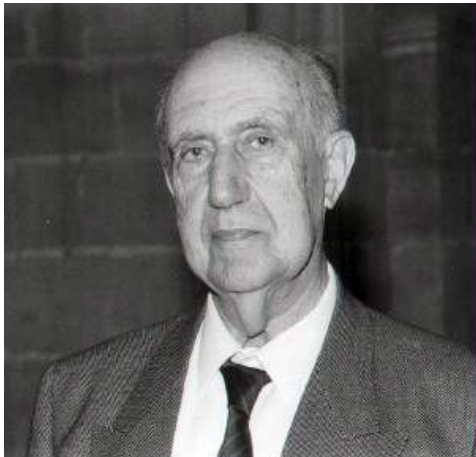
Antonio Domínguez Ortiz, historiador.