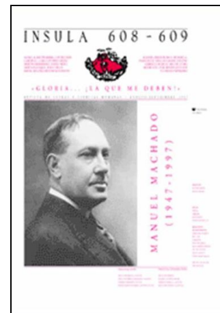
Manuel Machado Ruiz, poeta y hermano de Antonio Machado.