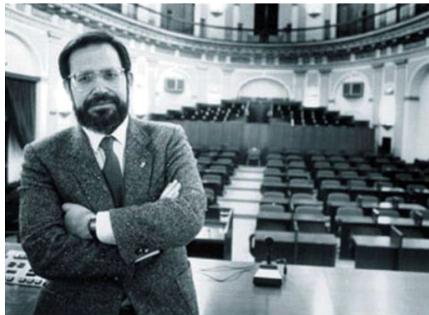
Ángel López López, catedrático de Derecho de la Universidad de Sevilla y Presidente del Parlamento Andaluz.