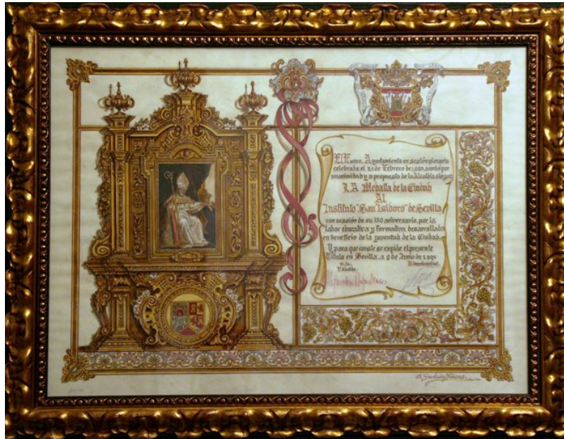
Pergamino de la entrega de la Medalla de Oro de la Ciudad.

Por las aulas del Instituto han pasado una gran cantidad de profesores y de alumnos, muchos de los cuales -alumnos y profesores- han sido personajes ilustres del mundo de la enseñanza, de la ciencia, de la política y de otros ámbitos de la cultura y de la vida de nuestro país, especialmente de nuestra ciudad.