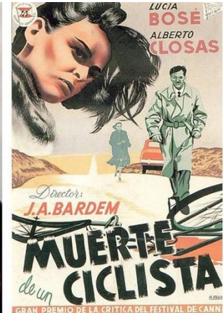
Juan Antonio Bardem, director de cine.