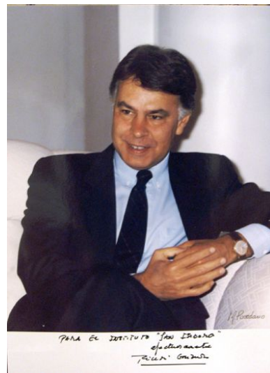
Felipe González Márquez, político y Presidente del Gobierno (1982-1996).