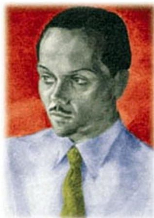
Luis Cernuda, poeta.