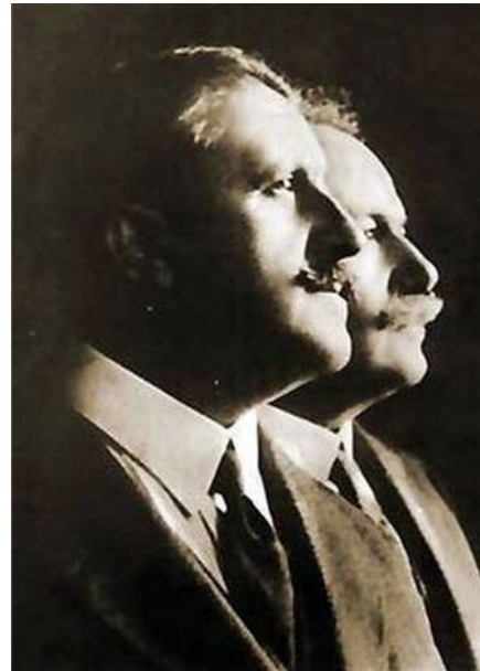
Hermanos Álvarez Quintero, dramaturgos.