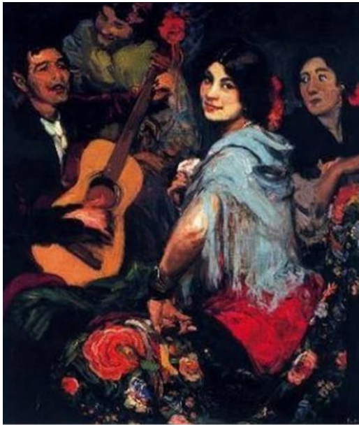
Obra de Gonzalo Bilbao Martínez, pintor costumbrista.