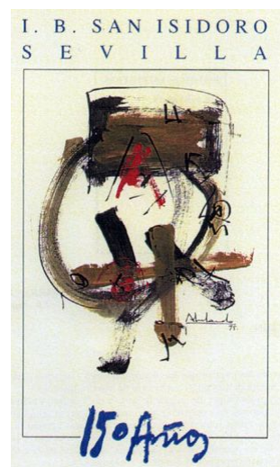
Commemoración 150 Aniversario.