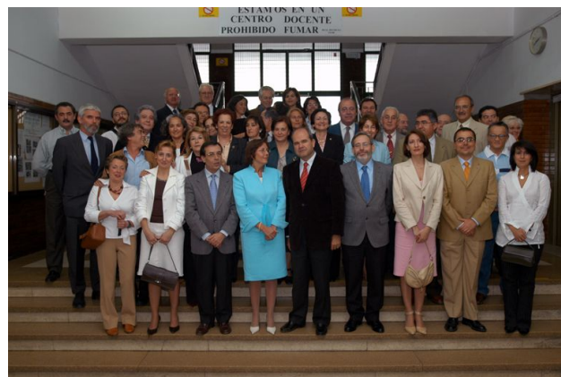
Celebración del 4º Centenario del Quijote. Visita del Presidente de la Junta de Andalucía, Manuel Chaves.