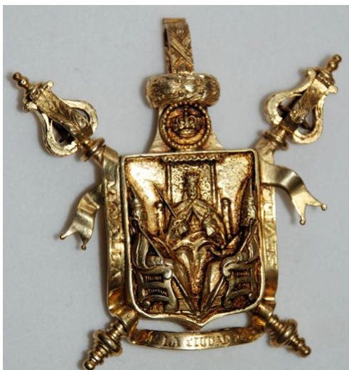
Medalla de la Ciudad de Sevilla.